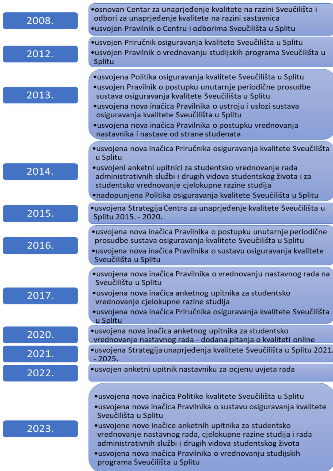
Slika 2: Prikaz razvoja sustava osiguravanja kvalitete Sveučilišta u Splitu kroz izmjene temeljnih dokumenata.